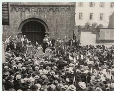
Retour de ces trois cloches, le 23 mai 1919

Mais intéressons-nous maintenant à la plus ancienne cloche suspendue depuis le XV ème siècle dans la tour porche ; c'est la GLORIA Glocke ou Bürgerglocke. Elle porte indifféremment ce vocable, car elle appelait les fidèles aux différents offices, sonnait le glas et les fêtes, mais elle sonnait également en cas de danger (tocsin) et pour les besoins des bourgeois de la cité (élection, assemblée du conseil de la ville, etc.).