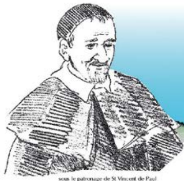
sous le patronage de St Vincent de Paul