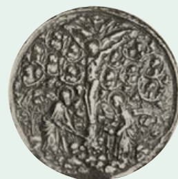
Sur ce médaillon de 9 cm de diamètre, on est saisi par la richesse et la précision du décor

Le Christ est accroché au cep de vigne comme sur la croix et de ce cep partent douze sarments qui portent les bustes des douze Apôtres. Au pied et sur la gauche se tient un homme qui ameublait la terre avec sa houx et l'inscription « Pater vivificat » (le Père ramène à la vie) Il s'agit donc de Dieu le Père qui comme vigneron soigne sa vigne. Sur la droite on peut voir une femme qui arrose le pied de vigne avec une cruche ; l'inscription qui l'accompagne dit : « Maria fecundat » (Marie féconde).