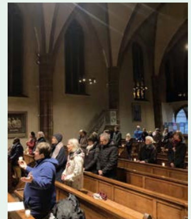
Veillée Marie à Saverne

“La compréhension est la récompense de la foi. Ne cherche donc pas à comprendre pour croire, mais crois afin de comprendre, parce que si vous ne croyez pas, vous ne comprendrez pas”. Saint Augustin