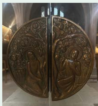
Contact : Bernard ZAPF SHASE

Cher paroissien, ou simple visiteur de notre église, en poussant la porte vitrée, même s'il ne vous est pas donné de voir la Gloria Glocke, vous en êtes très proche !