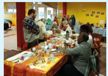
Figurines bibliques, la joie de préparer Noël